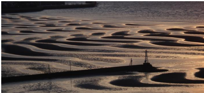
ケアプラザ宇土から近く大変に美しい「御輿来海岸」です。日本の夕日百名選にも選定されています。

このたび、ケアプラザ宇土では、施設の最近の出来事や入居者の皆様の暮らしぶり、近くの名所等を掲載した広報誌「不知火だより」を発行することといたしました。職員の手作りのため、誤字脱字や不明瞭な写真等があるかもしれませんが、楽しい話題と読みやすく、皆様に喜んでもらえるような広報誌にしたいと思っております。是非、ご愛読いただきますようお願い申し上げます。