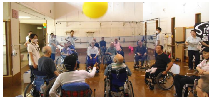
たくさんの入居者が参加したソフトバレーボールでは紅白に分かれて激戦となりました。普段の表情と全く異なる眼差しは真剣そのものです。