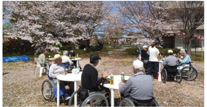
快晴のなか、満開の花のもとで仲間と食べる松花堂弁当の味は格別で、最高の食事でした。