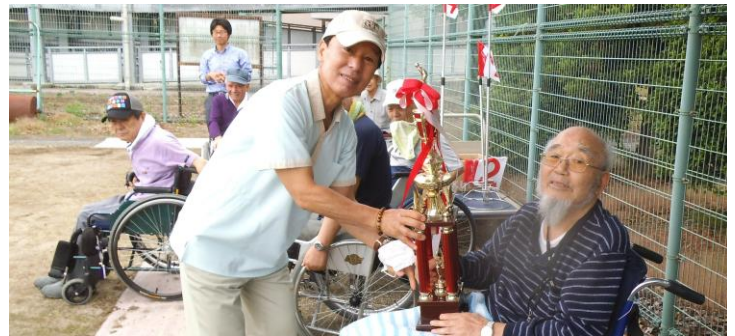
多くの入居者がハンデ無しでの真剣勝負を楽しみました、優勝者には施設長から大きなトロフィーが手渡され楽しいひと時を過ごしました。