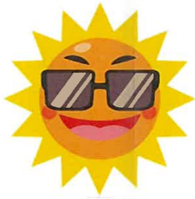
【クロスワードパズルのこたえ】 あざらし

安全管理対策推進委員会からのお知らせです。このところの富谷市は、おおむね三十度を超える暑い日が続いています。気温が高い、湿度が高い、風が弱い、日差しが強い、照り返しが強いといった条件が重なると、屋外だけでなく屋内でも熱中症を発生しやすくなってしまいますので、こまめに水分を補給する、涼しい場所を過ごす、部屋の風通しを良くする、外出を控える、など自分でできる熱中症対策を心がけましょう。