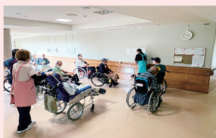
あまりにも難問（珍問？）でブーイングを受けたクイズ