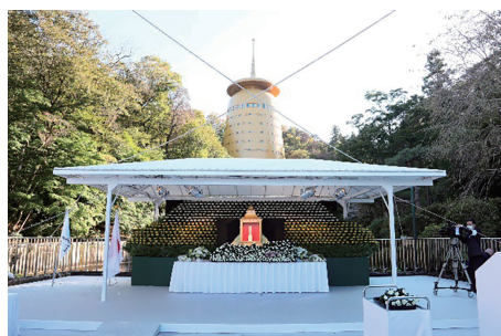
高尾みころも霊堂

産業殉職者合祀慰霊式は、産業災害で亡くなられた方々の尊い御霊をこれまでに奉安された方々の御霊と合祀するとともに、安全な職場環境の実現と労働災害の根絶に向けて努力することを御霊の前で誓う式典で、毎年秋に開催され今年で52回目となります。