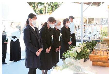
礼拝される招聘者の皆様