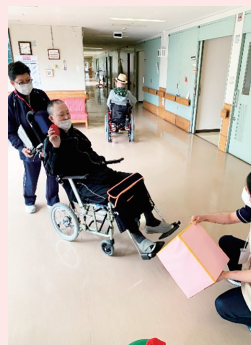
カゴが近づく玉入れ