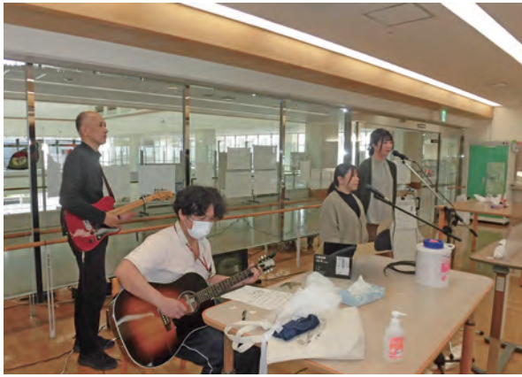
ミニコンサートの様子