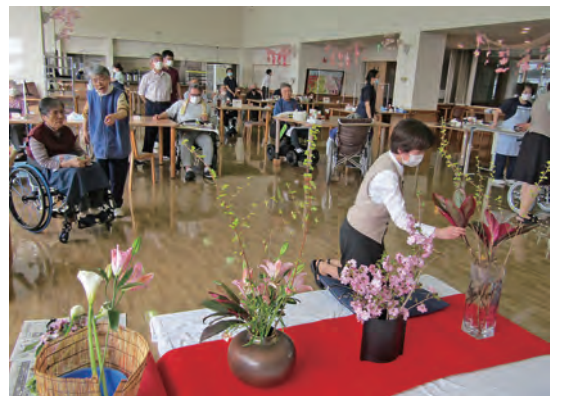
お花を生ける様子

4月5日(水)に「お茶会&いけばな」のコラボレーション行事を開催しました。入居者の方々は、それぞれ好みの器を選んでいただき、師匠が点てたお茶をお菓子と共に