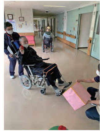
カゴが近づく玉入れ