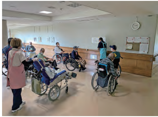
「脳トレとんちクイズ」に正解すると、みなさん拍手で大いに盛り上がりました

難関ポイントとなり、入居者の皆様が苦戦すると思っていました。当日は風が味方となり、桜吹雪の中に入ると全身に桜の花びらがつき、あつという間にクリアされました。 これからも、入居者の皆様が身体を動かしながら楽しんでいただけるよう、趣向を凝らしたスタンプリーを企画して参りたいと思います。