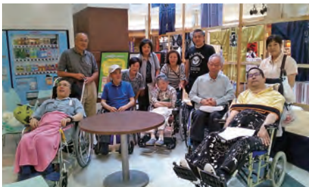
前回の買い物ツアーの様子

当委員会では、これまでに培った施設の感染防止対策のノウハウを活用し、本年度からは、徐々に行事の再開を目指すことを目標とし、先ずは皆様からのご要望が多かった買い物ツアーの再開を企画させていただきました。