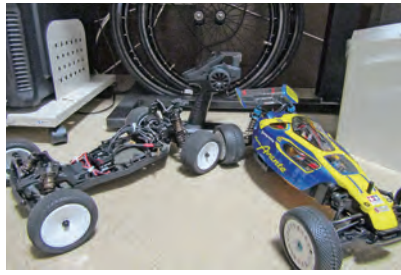
皆でチューニング中の1台

「コロナ禍で「なにもできない」「ムジにもうけない」状況となり、以前から You Tube を見てやりたいと考