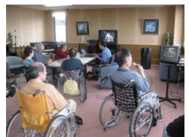
カラオケを楽しむ様子