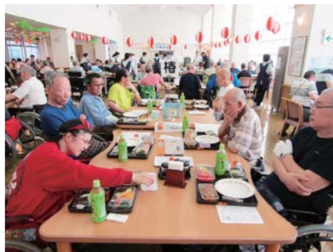
食堂で開催された納涼祭の模様

り、会場となった食堂は大盛り上がりで、コーラスボランティアアさんと合唱を楽しんだり、豪華なバーベキューの食事を味わったり、今年も盛大なお祭りを開催することができました。