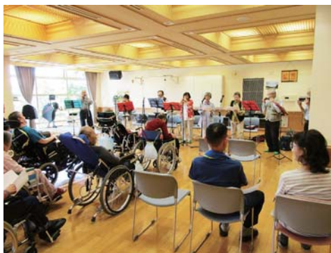
多目的ホールで開催されたハーモニカ演奏会の模様

6月13日ケアプラザ富谷で、「音楽の日〜ハーモニカ演奏会〜」が開催されました。地元サークル「ハーモニカと歌を楽しむ会」の方々が懐かしい曲を16曲演奏してくれました。入居者様のリクエスト「アメリカン・ジャズ」や珍しい「バス・ハーモニカ」の演奏が好評でした。耳にしたことがある曲の演奏が多く、参加した入居者の方々も一緒に口ずさむことができ、楽しい午後の一時を過ごしました。