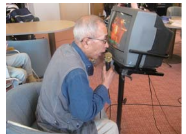
視覚障害の方も参加しています

毎月、第4木曜日はカラオケの日として、歌好きな方たちがコミュニティホールに集まります。十八番の曲を入れる人、昔の曲を思い出しながら歌う人、声の出具合で曲決めする人など、参加者それぞれが、その日の気分ですべて歌っています。 参加人数によって歌える回数は変わりますが、皆さん仲良く、毎回楽しい時間を過ごされています。