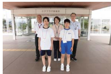
ワークキャンプ参加者と記念撮影

2泊3日のワークキャンプで、バスの乗降リフトの操作・車椅子での乗車体験を行ったり、レクリエーションで風船バレーを行ったりしました。初日は、学生も緊張の面持ちでしたが、時間が経つにつれて緊張もほぐれ笑顔が見られるようになりました。学生2人とも、食事介助のときに入居者様が自助具を使用していたこと、リフト体験をしたことの2点が印象に残ったとの事でした。本企画の経験は必ず将来に活かすことができるものだとして期待しております。