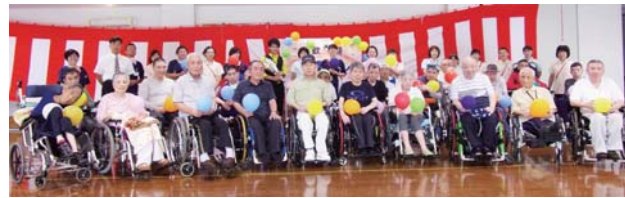
みんなで記念撮影