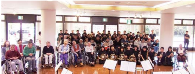
吹奏楽部の生徒と記念撮影

昭和のCMメドレーでは懐かしい全23曲がテンポよく次々と展開され、入居者様も懐かしみながら聞き入っておられました。最後の曲は「我ががカーブ」の応援歌。入居者の方々にはカーブのイメージカラーである赤い色の風船を持って頂き、吹奏楽部の皆さんと一緒に盛り上がりました。演奏途中、感極まって涙ぐみながら拍手をされる入居者様の姿も見られました。芸術の秋を堪能できた時間でした。