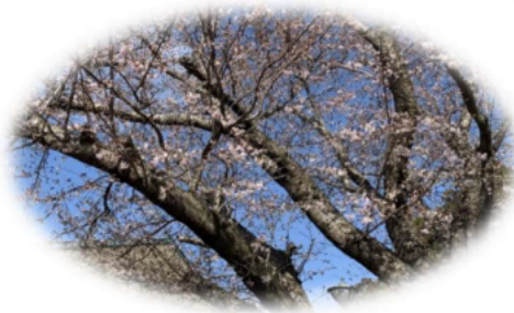
施設の桜も咲き始め、 まもなく満開を迎えそうです。