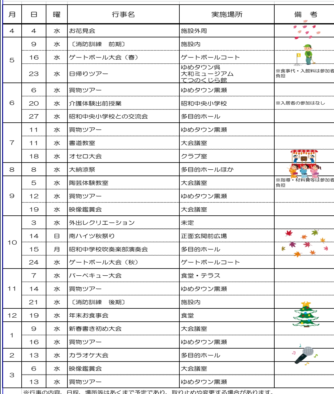
平成30年度 年間行事計画

※行事の内容、日程、場所等はあくまで予定であり、取り止めや変更する場合があります。