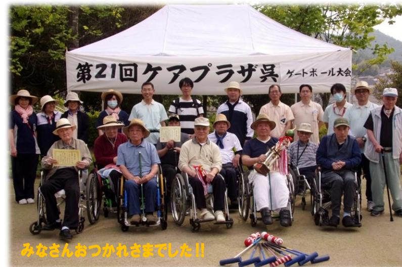
みなさんおつかれさまでした!!