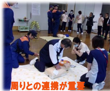
周りとの連携が重要