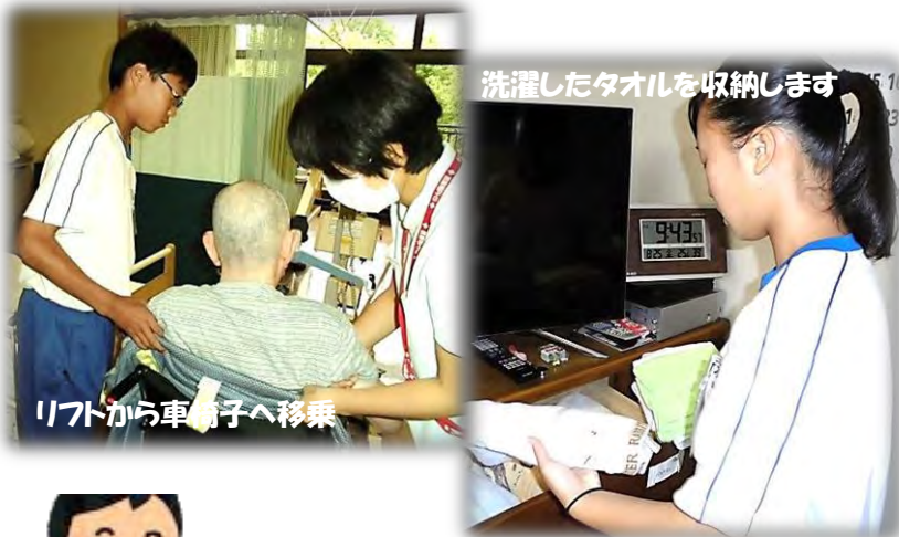
リフトから車椅子へ移乗