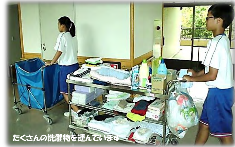
たくさんの洗濯物を運んでいます