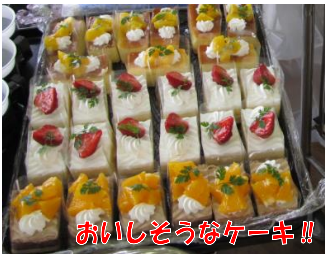
おいしそうなケーキ!!

また、クリスマスプレゼントには、来年のカレンダーを配りました。この時期のカレンダーは入居者の皆さんが心待ちにされているばかりか、暦を見ることで、認知症対策にも効果があるそうです。